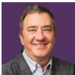
DR. HENRY CLOUD

A Habits Academy alapítója, bestseller író